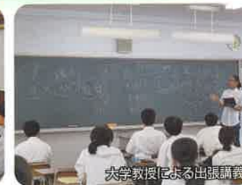
大学教授による出張講義