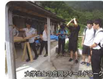
大学生との合同フィールドワーク