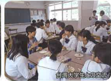
台湾大学生との交流