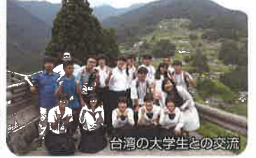
台湾の大学生との交流