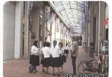
フィールドワーク