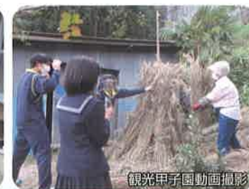
銀光甲子園動画撮影