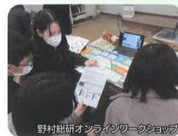
野村総研オンラインワークショップ