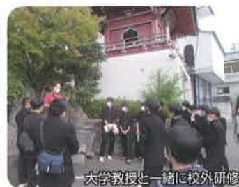
大学教授と一緒に校外研修