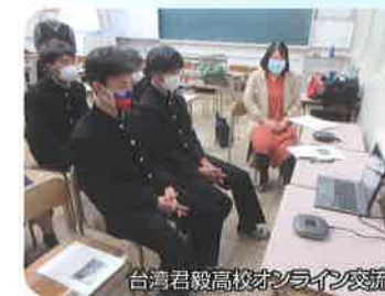
台湾君毅高校オンライン交流