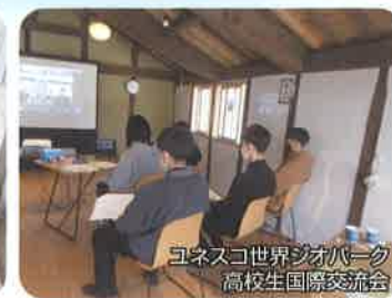
ユネスコ世界ジオパーク高校生国際交流会