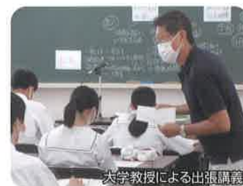
大学教授による出張講義