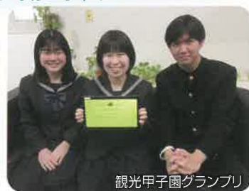
観光甲子園グランプリ