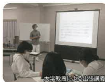
近隣の大学や県外の企業にも足を運び、たくさんの刺激を受けることができます！