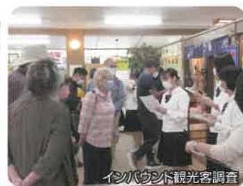
インバウンド観光客調査