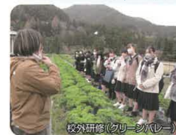
校外研修(グリーンシーレー)