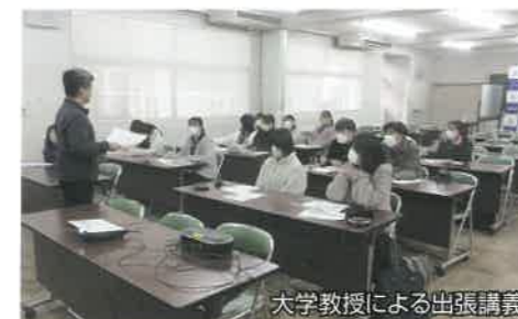
大学教授による出張講義