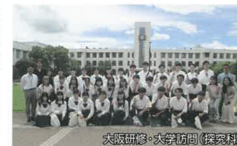
大阪研修・大学訪問(探究科)