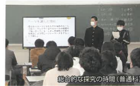
総合的な探究の時間(普通科)