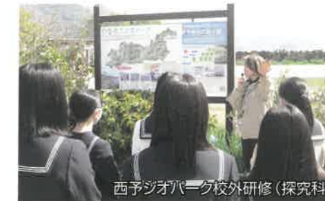
西予ジオパーク校外研修(探究科)

地域でのフィールドワークや国際交流、大学との連携など、池田高校では様々なことを「知り、感じ、体験し、共有する」ことができます！