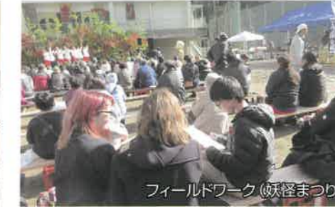
フィールドワーク(妖怪まつり)