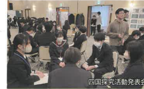
四国探究活動発表会