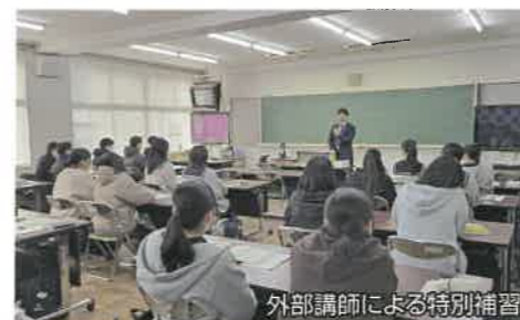
外部講師による特別補習